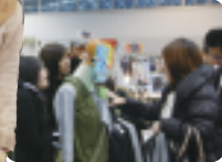
6着を売上!お客さんとのコミュニケーションもばっちり!