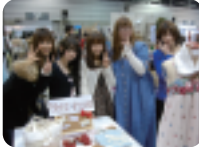
初出展となった1年生は、商品を売る難しさを実感。