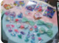
お客さんの目を引くようにディスプレイにもこだわり!