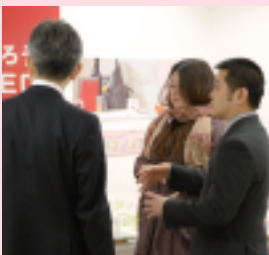
企業の方と会場で面談！「1度じっくり話しましょう」との言葉が！

なデ学ではこの他にも就職バックアップの機会をたくさん用意して、学生の就職活動を支援しています！