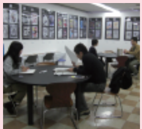
講談社から編集者が来校！目の前で作品の講評を受けます。担当編集者がついた学生も！