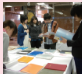
就職活動を控えた1年生のポートフォリオ(作品集)がズラリ！

卒業制作展と時を同じくして行われた大収穫祭。その名称には「なデ学ではこんな学生が育っています」というお披露目、そして企業の方から見て「早くから人材を確保できる場」という2つの意味がありました。そう！大収穫祭とは、社会に向けて自分の力をアピールするイベントなのです。この機会を通して、多くの学生が企業の方と接点を持ちました。